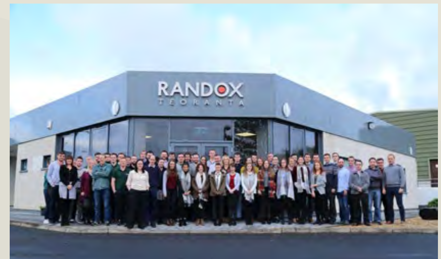
Foireann Radox i nGaeltacht Dhún na nGall