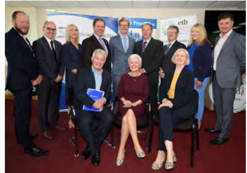
Seoladh Comhpháirtíocht nua idir Údarás na Gaeltachta, BOO Dhún na nGall agus Pramerica.

Forbraíodh cúrsa oiliúna nua san Uath-Thástáil Bogearraí i nGaoth Dobhair i gcomhpháirt le Pramerica agus Údarás na Gaeltachta. Seachadadh an cúrsa i gteic Ghaoth Dhobhair, ar mhaithe le deiseanna fostaíochta a fhorbairt do phobal na Gaeltachta sa gcomhlacht, Pramerica.