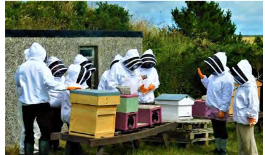
LAN CTR Cill Ulta

Le buiséad €1.9m, ritheadh an togra seo go mí Iúil 2020. Ba é cuspóir an togra ná go mbeadh na Pobail Áitiúla Fuinnimh Inmharthana (LECo) a bunaíodh le linn an togra féin-dóthaineach ó thaobh fuinnimh de agus go mbainfeadh siad úsáid as foinsí in-athnuaite áitiúla.