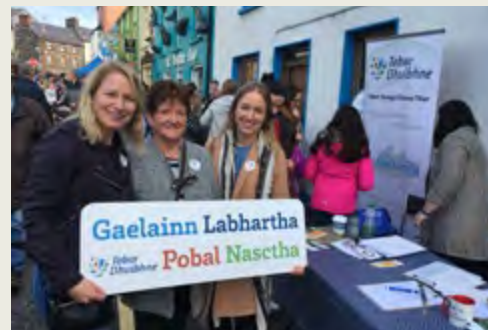
Féile Bídih Tobar Dhuibhne