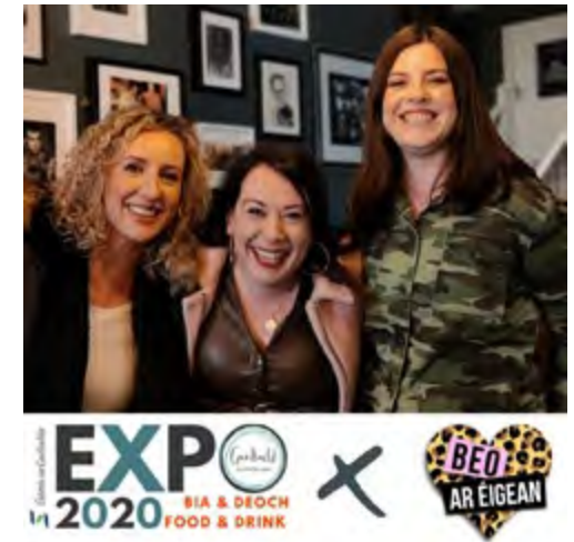
EXPO Bia & Deoch

Reáchtáladh, mar shampla Expo Ceardaíochta agus Expo Bia agus Deoch, ag obair i gcomhar le ceardaithe agus táirgeoirí chun solas a scaladh ar a gcuid saothair agus chun cur lena gcuid deiseanna díolachán.