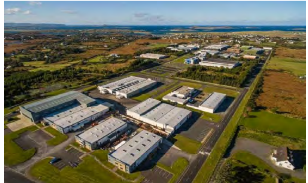
Páirc Ghnó Ghaoth Dobhair

Tugadh faoi thogra fótvoltach pobail i gcomhar le Comharchumann Mhic Dara Teo. ar Pháirc Ghnó na Ceathrún Rua, ag cruthú múnla d'eagrais forbartha pobail Gaeltachta eile gur mian leo a leithéid a fhorbairt.