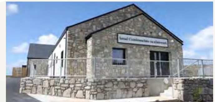
Ionad Feamainn & Oidhreacht Leitir Mealláin