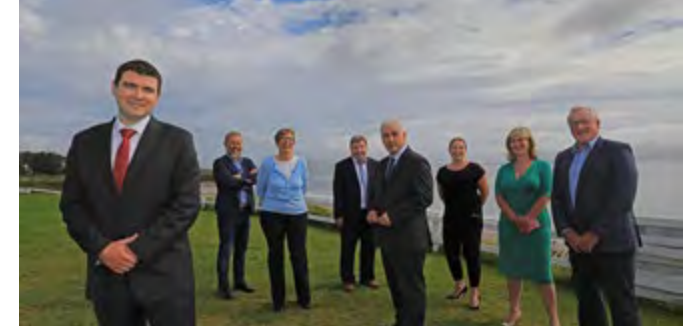
Tharraing seoladh an Plean Iorras Aithneach go leor poiblíochta.