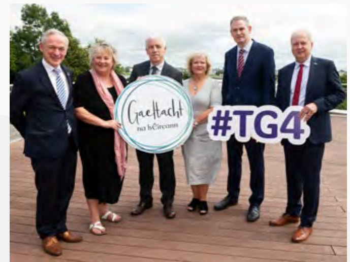
Seoladh Scéim Forbatha Oiliúna TG4