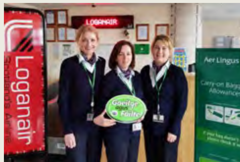
An comhartha 'Gaeilge & Fáilte' á léiriú go bródúil in Aerfort Dhún na nGall