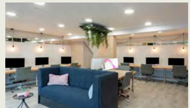
gteic Arainn Mhór