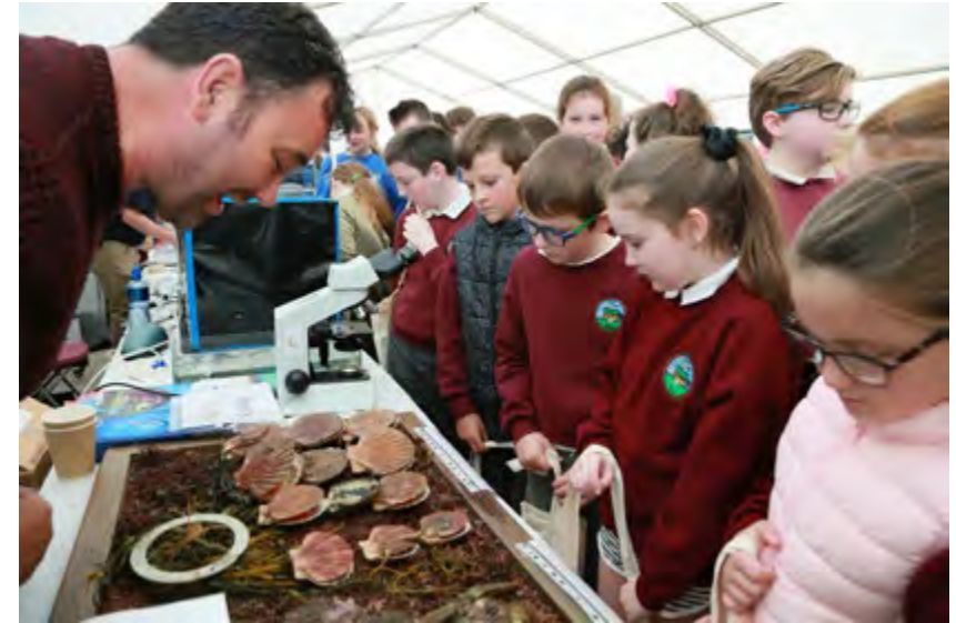
Lá na Mara – Cill Chiaráin 2019

I measc na n-imeachtaí a d’eagraigh an tÚdarás i gceantar Iorras Aithneach a bhí bainteach le Páirc na Mara, bhí Lá Mara 2019 agus Lá Fuinnimh don Phobal. Cuireadh gnéithe a bhain le Páirc na Mara, ar nós bia agus táirgí farraige eile, tograí mara agus fuinneamh inathnuaite, os comhair an tslua shuntasáigh a d’fhreastail ar na himeachtaí. Tionóladh Lá na Mara Údarás na Gaeltachta don dara bliain in 2020, ach go fíorúil de bharr na paindéime. Thug saineolaithe náisiúnta agus idirnáisiúnta mara a gcuid saineolais agus taithí ar inbhuanaitheacht acmhainní nádúrtha. Pléadh na bealaí go bhféadfadh feirmeoireacht bia mara cabhrú le gníomhaíocht aeráide agus caighdeán bainte feamainne chun inbhuanaitheacht a chinntiú i measc ábhair eile