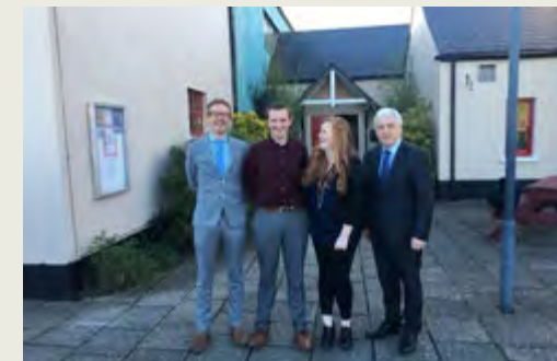
Seoladh Plean Teanga na Mí