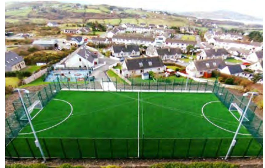
Páirc uile-aimsire, An Fál Carrach

Údarás na Gaeltachta mar chomhpháirtí i gcur i bhfeidhm clár LEADER i nGaeltachtaí Dhún na nGall agus Corcaigh. Cuireadh críoch leis an gClár LEADER reatha 2016 – 2020 ag deireadh na bliana agus ceadaíodh buiséad iomlán deontais de €1.764m a rinne infheistíocht i 49 togra tionscadail faoi na téamaí: Leathanbhanda, Turasóireacht Tuaithe, Seirbhísí dírithe ar Phobail Imeachacha, Timpeallacht, Forbairt na Fiontraíochta agus Bailte Tuaithe.