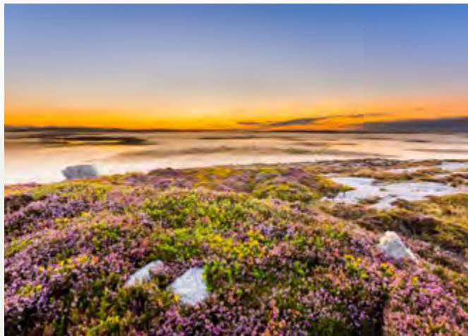
Cnoc Leitir Móir

Pobal inbhuanaithe Gaeltachta a chothú ina mbeidh an Ghaeilge mar príomhtheanga, le heacnamaíocht láidir ag baint úsáid inbhuanaithe as na hacmhainní go léir a bheidh ar fáil agus le caighdeán maireachtáil den chéad scoth.