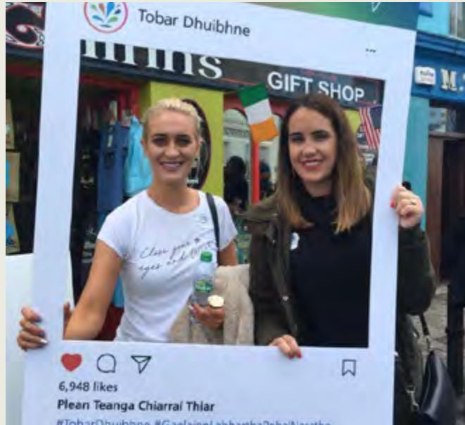
Féile Bídih Tobar Dhuibhne