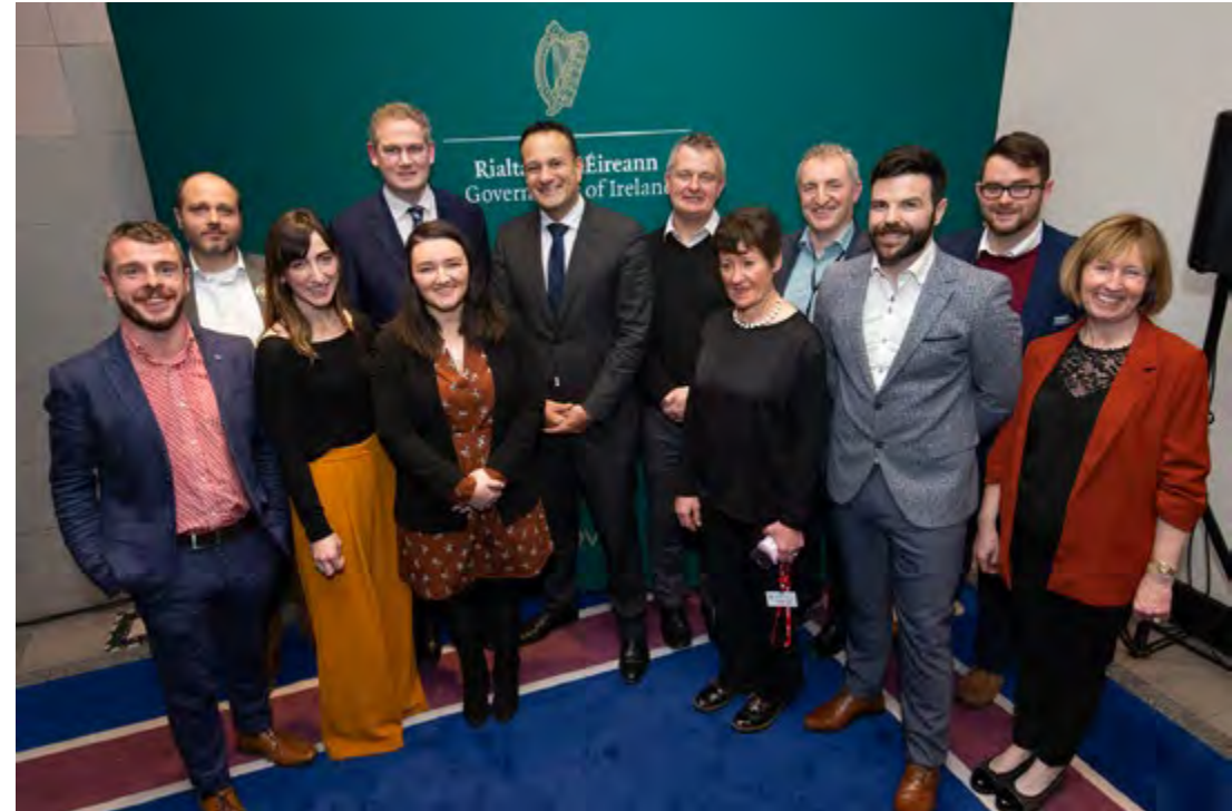
Oifígh Pleanála Teanga leis an iar-Thaoiseach i mBaile Átha Cliath, 2019.

Creideann Údarás na Gaeltachta gur ón mbun aníos, i gcomhar le na pobail, seachas ón mbarr anuas, is fearr oibriú chun an seod is luachmhaire dá bhfuil againn, an Ghaeilge, a neartú agus a láidriú fud fad na Gaeltachta