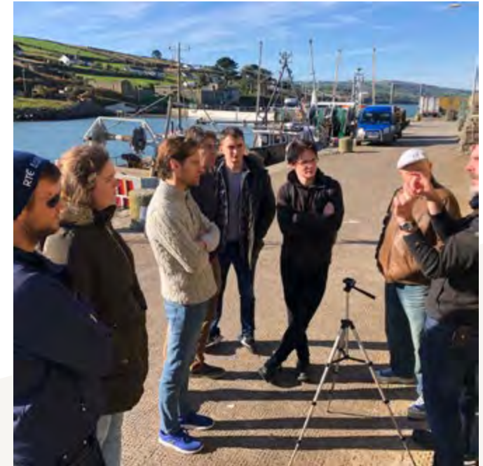
Cúrsa Ard-Diplóma i Léiriú Teilifíse