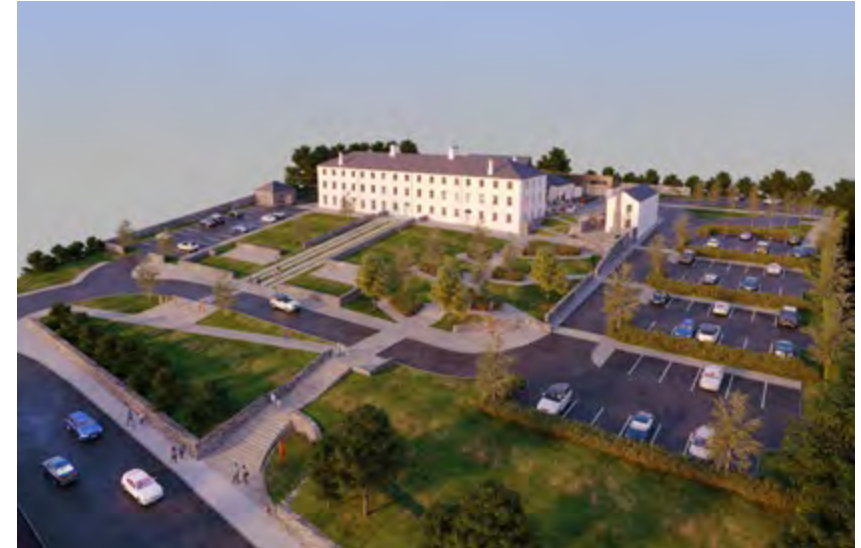
Sean Ospidéal an Daingin

D'éirigh leis an Údarás maoiniú seachtrach €415,000 a aimsiú faoin gCiste um Athghiniúint agus Forbairt Tuaithe chun máistirphlean a chur le chéile don togra Sean Ospidéal an Daingin.