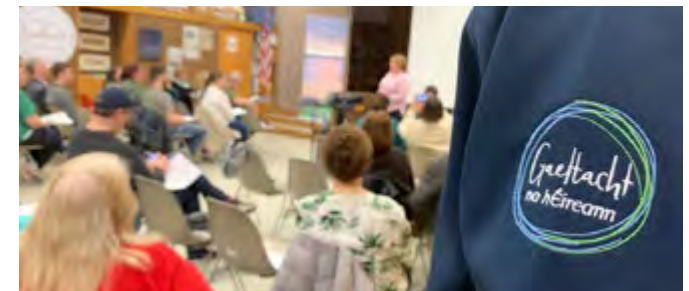
Ócáid Ireland's Gaeltacht Experience i mBostún