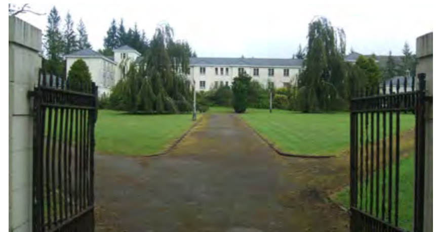
Coláiste Íosagáin roimh athfhorbairt.