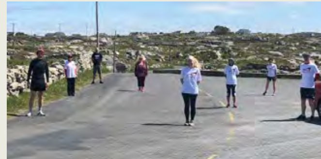
Imeacht folláine Phobal Rua, An Cheathrú Rua